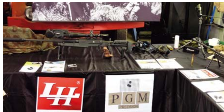
PGM Scharfschützengewehr in .338 Lapua Magnum in Komplettausstattung mit Schalldämpfer und Nachtsichtgerät.