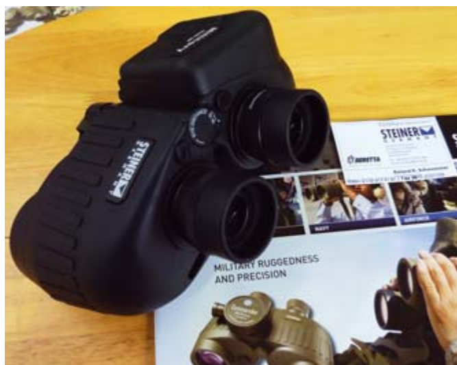
Das neue Steiner Military 10x50 LRF vereint eine leistungsstarke Beobachtungsoptik mit Laserentfernungsmesser und verspricht dabei Messungen bis zu 1.500 Metern.