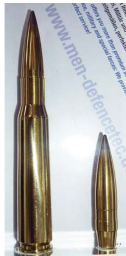
Riesenbaby: Die Firma MEN stellte ihren neuesten Sprößling in der Sniper Line im Kaliber 12,7x99 vor. Das 768 Grains schwere SAPI (Solid-Armour-Piercing-Incendiary) Projektil soll mit seinem Hartkern auf 1.100 Metern sogar noch 10 Millimeter Panzerstahl durchschlagen.

TeutoDefence Germany, Holger Veh Weserstrasse 225, 32547 Bad Oeynhausen Telefon: +49-(0)5731-796971 Fax: +49-(0)5731-92412, www.teuto-defence.com veh@teuto-defence.com