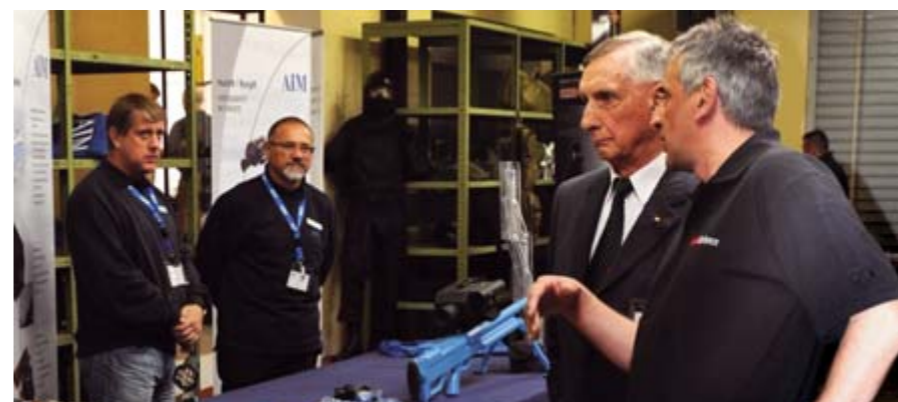
General a. D. Ulrich K. Wegener, Gründer der bekannten Grenzschutzgruppe 9, verschaffte sich selbst einen Überblick über die Neuheiten im Behördenbereich.

Das mag bei diesem Longe Range Kaliber aus erster Sicht wie ein Widerspruch klingen, doch die Idee die dahinter steckt, war es, Trainingspatronen zu entwickeln, die auch auf kleineren Schießständen ohne kilometerweiten Sicherheitsbereich verwendet werden können. Erreicht wird dies nicht etwa durch ein leichteres Geschoß oder eine geringere Mündungsgeschwindigkeit, sondern durch drei axial in den Mantel des 577 Grains (37,4 Gramm) schweren Geschosses eingebrachte halbkreisförmige Vertiefungen. Nach etwa 1.000 Metern erreicht das Projektil eine bestimmte Grenzgeschwindigkeit, die dann zum Taumeln führt und damit das Geschoß stark verzögert. Diese Technik nutzen die smarten Fin-