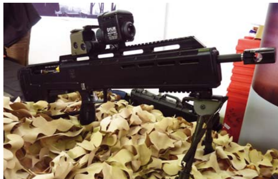
Der Umrüstsatz für das Heckler & Koch SLB 2000 wird von der Firma Liemke in Kleinserie hergestellt und verleiht dem Selbstlader eine extreme Handlichkeit und ein völlig neues Erscheinungsbild.