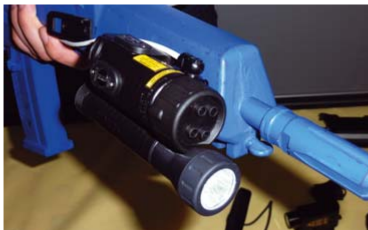
Der Name ist Programm. Das "Vario Ray" der Firma Rheinmetall vereint Licht, IR-Strahler, Rotpunkt und IR-Laser und verfügt zudem noch über ein Freund-Feind-Erkennungssystem. In der Dunkelkammer konnte man das Multifunktionsgerät selbst ausprobieren.